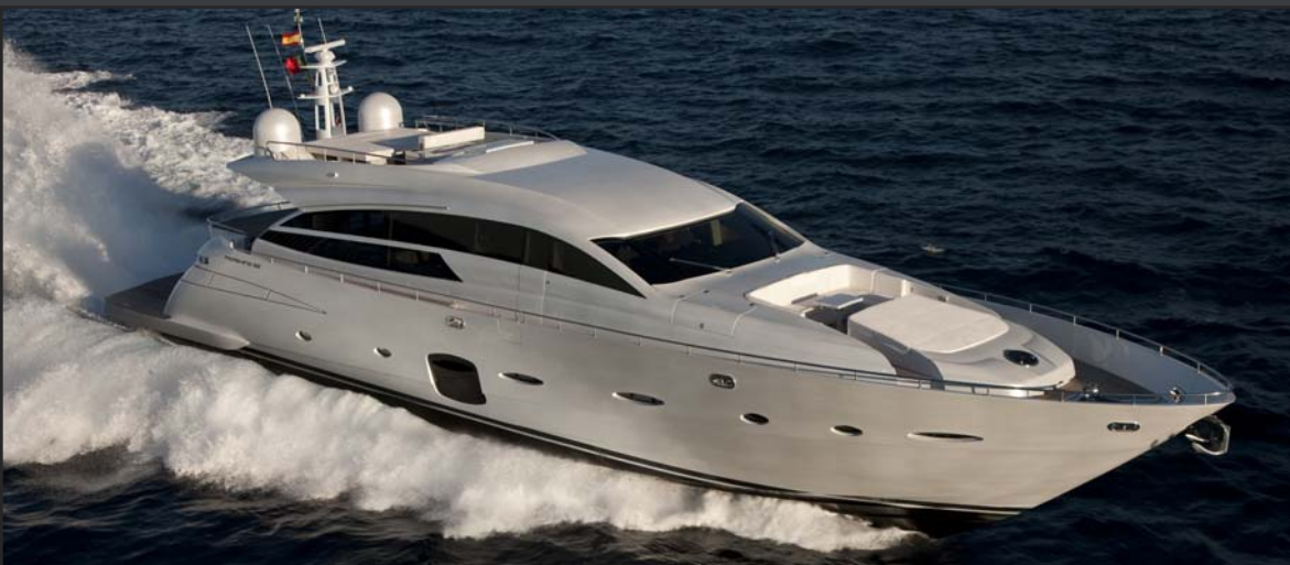
TECHNICAL SPECIFICATION & STANDARD