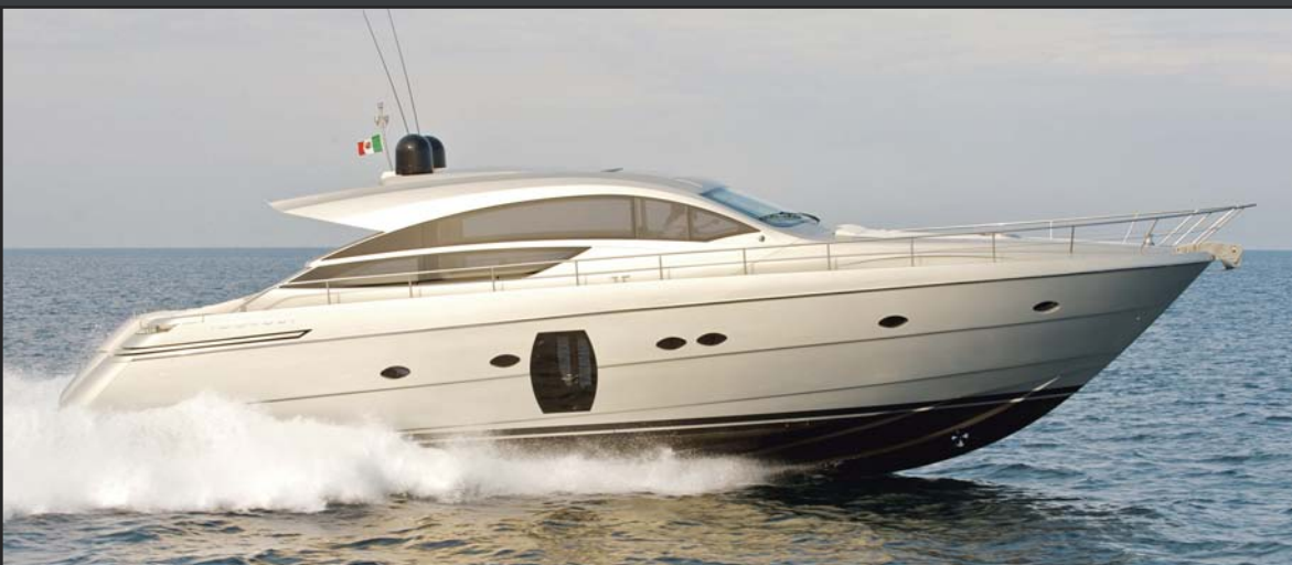
TECHNICAL SPECIFICATION & STANDARD